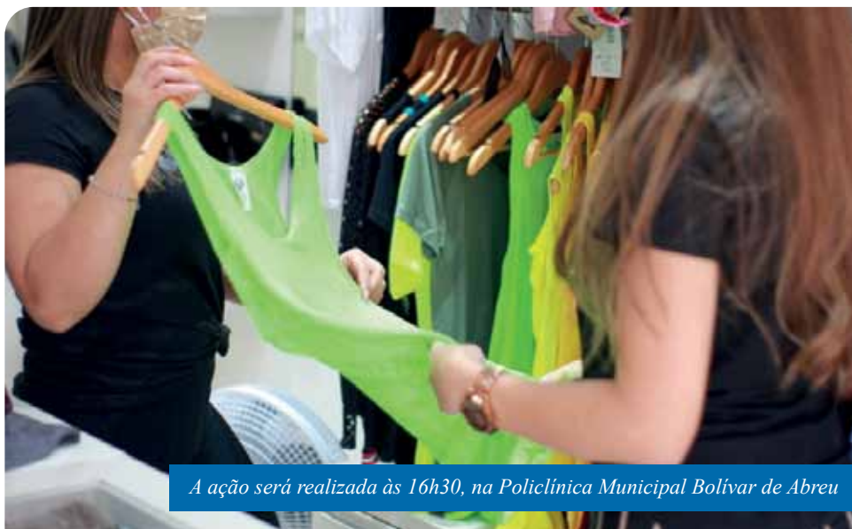
A ação será realizada às 16h30, na Policlínica Municipal Bolívar de Abreu

Em Cachoeiro, a equipe de fiscalização do Procon visita pontos comerciais, nesta semana, visando coibir propagandas enganosas relacionadas, principalmente, à Black Friday, que ocorre nesta sexta-feira