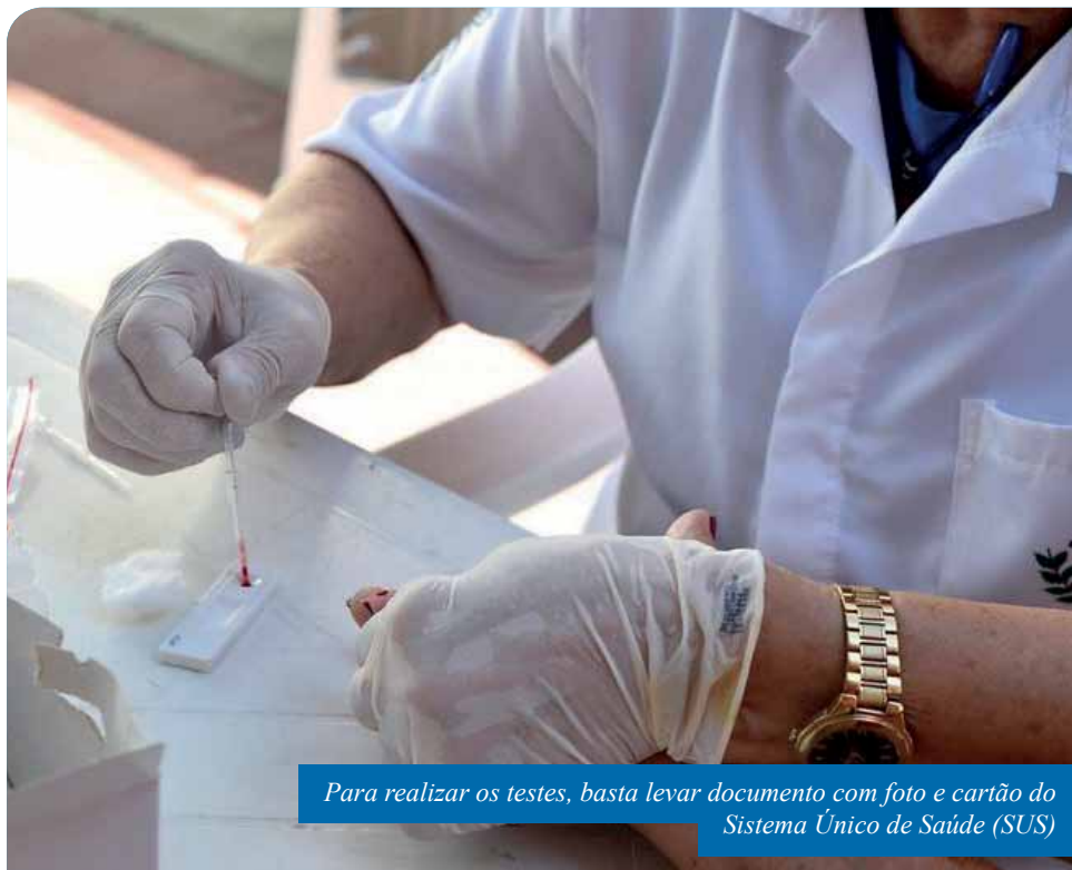
Para realizar os testes, basta levar documento com foto e cartão do Sistema Único de Saúde (SUS)

Vale lembrar que os testes rápidos para DSTs estão disponíveis na rede pública de saúde de Cachoeiro. É possível requerer o exame na sede